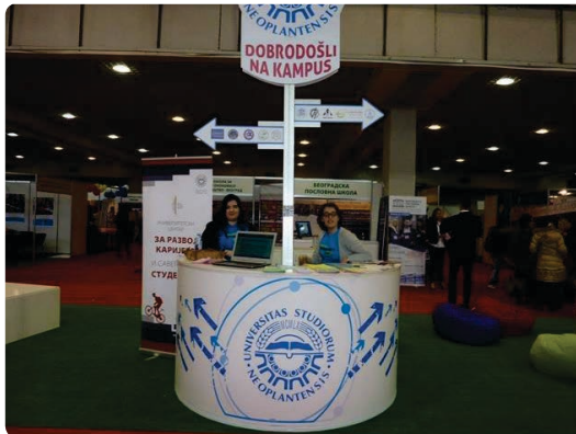
Сајам образовања Путокази 2015. године

Центар има велики значај у повећању каријерне информисаности студената. Начин дисеминације информација прати савремене трендове, те осим класичних видова обавештавања путем огласних табли Центар информише студенте преко мејлнг листе Центра, путем сајта Центра и преко друштвених мрежа. Годишње се проследи преко 200 огласа за праксу, усавршавање, посао и слично.