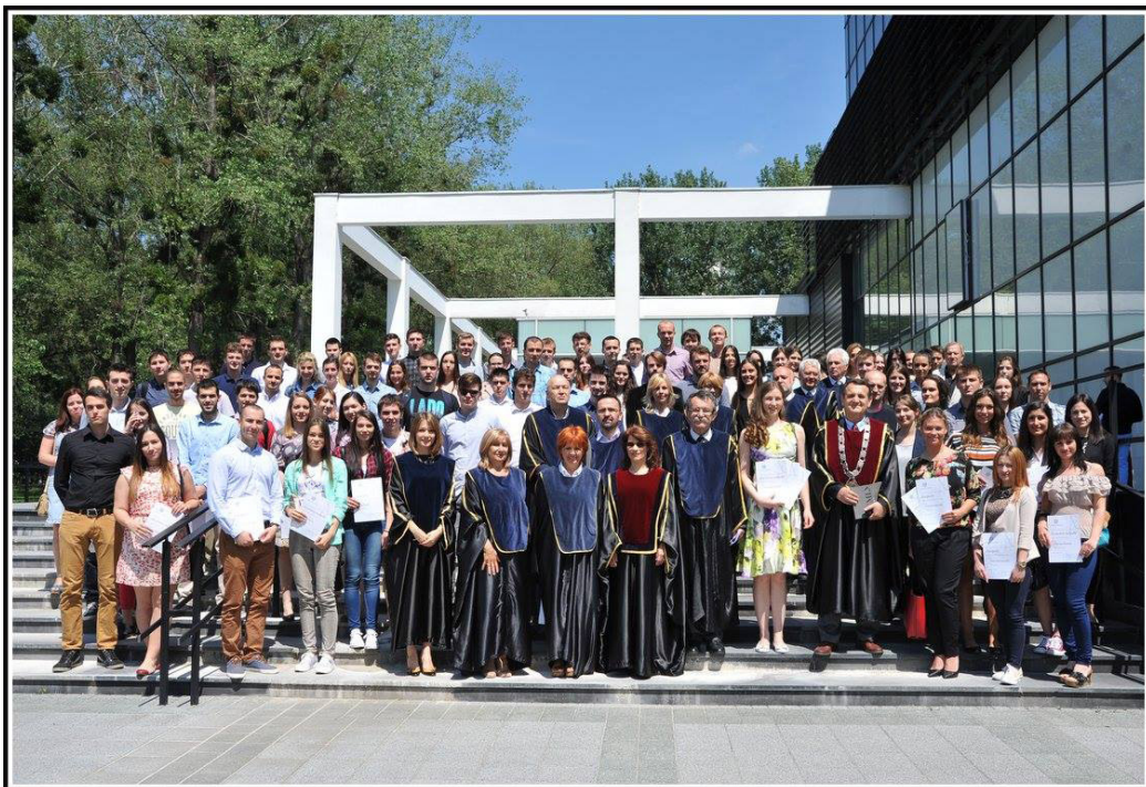
Свечана додела награда најбољим студентима Универзитета у Новом Саду за постигнут успех у школској 2013/2014 години

Универзитет сваке године додељује студентима награде за постигнут успех у студирању, стручном и научном раду, уметности и спорту.