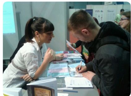
Сајам образовања Путокази 2013.