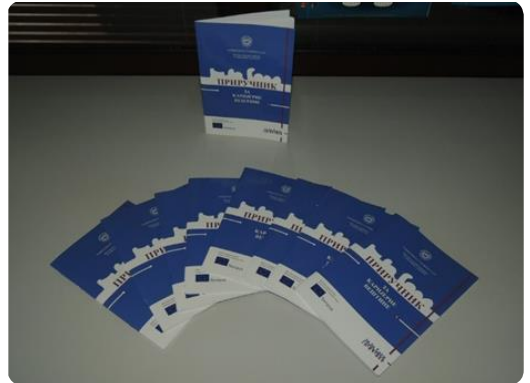
у оквиру ТЕМПУС пројекта INTERFACE