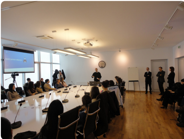
Слика са промоције

Универзитет у Новом Саду Центар за развој каријере и саветовање студената, уз помоћ донације Америчке амбасаде, је путем овог пројекта омогућио својим студентима и дипломцима да 24 часа дневно имају на услузи софтвер за вежбање интервјуа за посао. Софтвер има и опцију да корисник сними свој одговор и тражи захтев да га прегледа каријерни саветник. Савети су доступни као видео и као текстовни материјал те је на тај начин омогућено особама са оштећењем слуха и вида да га користе.