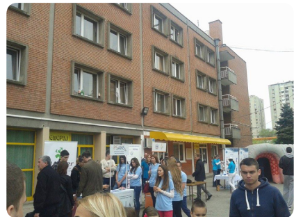
Међународни дан здравља 2014.