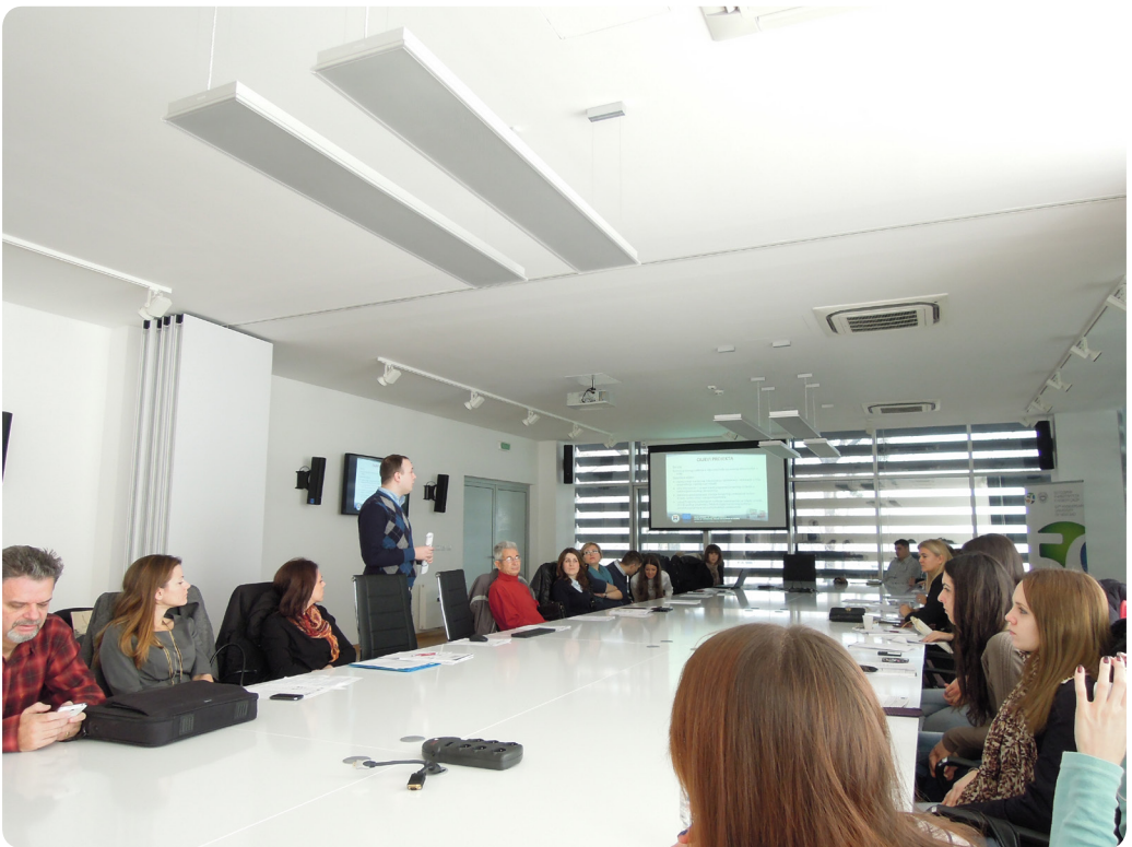
Округли сто под називом "Потребе послодаваца – пожељне вештине и знања будућих запослених"

Дана 23. децембра 2013. године, у просторијама Централне зграде Ректората Универзитета у Новом Саду одржан је округли сто под називом "Потребе послодаваца – пожељне вештине и знања будућих запослених" у склопу ТЕМПУС CAREERS пројекта. Циљеви догађаја су били: представљање потреба послодаваца у погледу пожељних профила будућих запослених и приближавање њихових потреба послодавцима; представљање актуелних трендова на тржишту рада; јачање сарадње између високообразовних установа и привреде и пружање увида послодавцима у могућности сарадње са центрима за развој каријере.