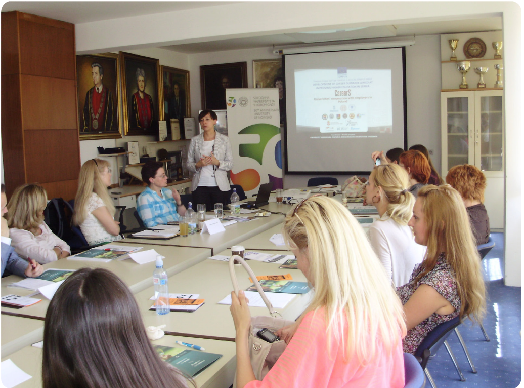
Округли сто под називом „Сарадња универзитета и послодаваца“

На Универзитету у Новом Саду је 13. јуна 2012. године одржан округли сто под називом „Сарадња универзитета и послодаваца“, у оквиру ТЕМПУС пројекта CAREERS. Овом приликом представили су се најбољи примери и програми сарадње са послодавцима које реализују универзитетски центри за развој каријере на универзитетима у Европи и Србији и разговарало о начинима на који послодавци могу да се укључе у активности универзитета које су усмерене на јачање запошљивости дипломаца и унапређење њихових вештина за управљање каријером. На округлом столу су се окупили представници свих партнера из Србије, Велике Британије, Италије и Пољске, међу којима су представници универзитета из ових земаља и компанија.