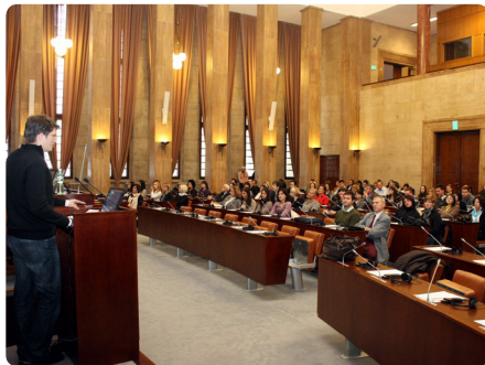
Слика са Свечаног отварања Програма радне праксе у јединицама локалне самоуправе

Циљ Програма радне праксе у јединицама локалне самоуправе је да се студентима и младим дипломцима пружи могућност да се непосредно упознају са радом органа локалних самоуправа и јавних комуналних предузећа у АП Војводини. По завршетку Програма у јединицама локалне самоуправе учесници су стекли СЕРТИФИКАТ који је потписан од стране председника Скупштине АП Војводине и ректора Универзитета у Новом Саду.