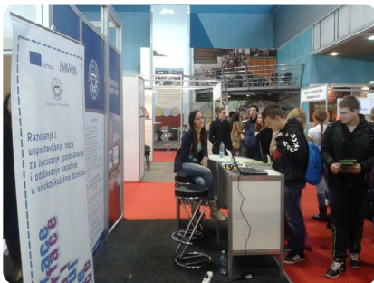
Сајам образовања Путокази 2014.