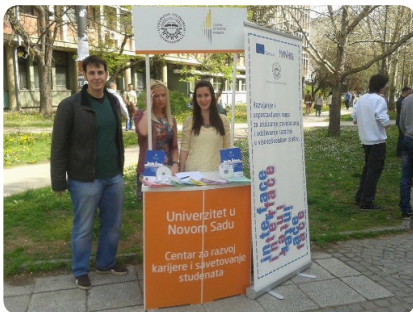
Међународни дан студената 2014.