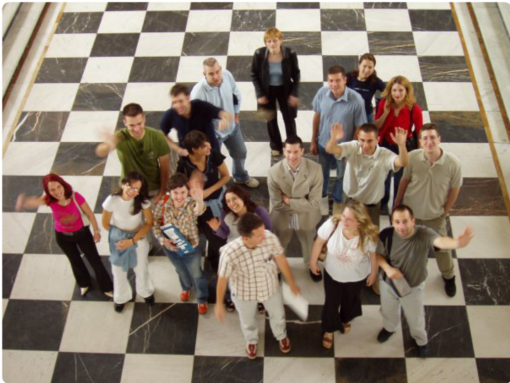
Слика у холу зграде Скупштине Аутономне Покрајине Војводине генерације Програма школске 2003/04 године