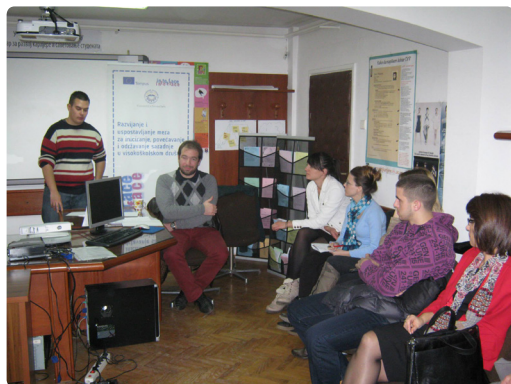
Дебата 2013. године