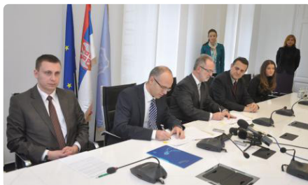
Слика са потписивања споразума 2013. године

Универзитет у Новом Саду је заједно са Градом Новим Садам током 2013. године покренуо Програм професионалне праксе студената у јавним и јавно комуналних предузећа чији је оснивач Град Нови Сад. Ослањајући се на веома позитивна искуства током прве године имплементације Универзитетског програма професионалне праксе у јавним и јавнокомуналним предузећима и високе оцене учесника и ментора у реализацији Програма, Град Нови Сад и Универзитет у Новом Саду заједнички су оценили да Програм треба не само наставити, већ и проширити у 2014. години. На основу тога студенти могу своја прва искуства да стекну и у градским органима управе, службама, установама и организацијама чији је оснивач Град Нови Сад, поред већ постојеће понуде за радну праксу у јавним и јавнокомуналним предузећима.