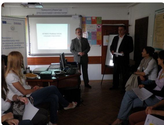
Дан отворених врата Центра 2013. године

ДАН ОТВОРЕНИХ ВРАТА УНИВЕРЗИТЕТСКОГ ЦЕНТРА ЗА РАЗВОЈ КАРИЈЕРЕ И САВЕТОВАЊЕ СТУДЕНАТА је био намењен студентима и младим дипломцима Универзитета у Новом Саду који желе да се ближе упознају са његовим услугама, а у оквиру ТЕМПУС пројекта INTERFACE . Обележавање Дана Универзитета у Новом Саду почело је 26-тог јуна 2013. године Даном отворених врата Универзитета Центра за развој каријере и саветовање студената. Студенти су у периоду 13–16 часова у просторијама Центра, могли да прођу кроз Тест професионалних опредељења и да добију одговарајућу интерпретацију резултата, обаве консултације и добију повратне информације на написан CV и мотивационо писмо и припреме се за будући пословни интервју помоћу софтвера који симулира разговор између кандидата и послодавца – Виртуелни интервју за посао.