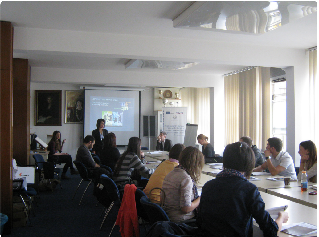
Инфо сесија под називом "Успостављање и јачање сарадње Центра за развој каријере и саветовање студената са академском заједницом"