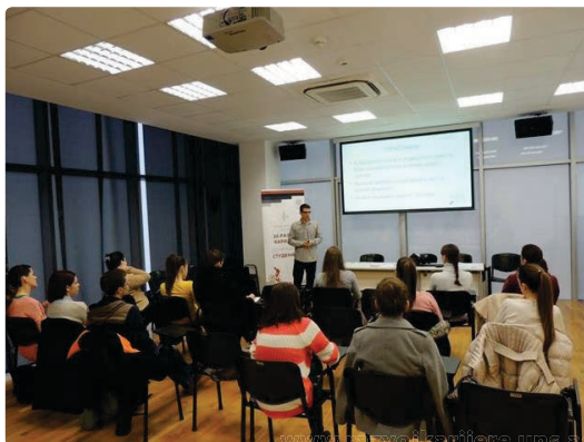
Слика са радионице

У оквиру пројекта TEMPUS CareerS је израђен Водич кроз дипломе како би студенти Универзитета у Новом Саду били препознатљивији на тржишту рада. Водич кроз дипломе је водич за послодавце, студенте и будуће студенте. Водич има за циљ да допринесе бољој информисаности како будућих студената о студијским програмима тако и послодаваца о реформисаним студијским програмима, лакшем препознавању нових образовних профила и диплома својих садашњих и будућих запослених са високом стручном спремом.